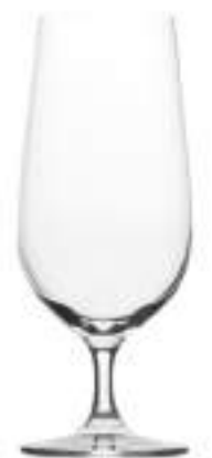
B657G2100019 Cerveza Beer 390 ml | 13¼ oz H 177 mm | 7" Ø 73 mm | 3" Palet 750 pcs