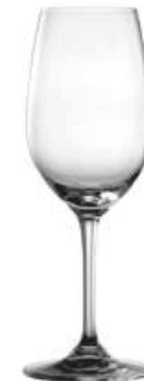
B657E1800002 Vino Blanco Wine Wine 360 ml | 12¼ oz H 213 mm | 8½" Ø 79 mm | 3" Palet 504 pcs