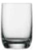
B657W1000020 Vaso Whisky Whisky Tumbler 80 ml | 2¾ oz H 65 mm | 2¼" Ø 47 mm | 1¾" Palet 1.728 pcs