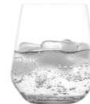
NEPO B657002 Vaso Tumbler 477 ml H 108 mm Ø 91,5 mm Palet 768 pcs