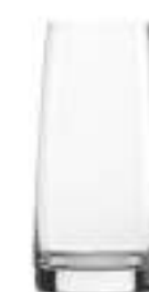
B657X3510013 Campirí Drink Campirí Drink 360 ml | 12¼ oz H 142 mm | 5½" Ø 68 mm | 2¾" Palet 1.044 pcs