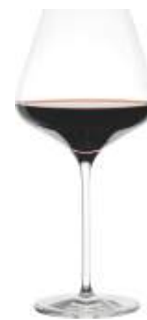
B657Q2310000 Borgoña Burgundy 710 ml | 24 oz H 245 mm | 9¾" Ø 116 mm | 4½" Palet: 216 pcs

Con QUATROPHIL, Stölzle Lausitz demuestra su alto nivel de precisión en la producción de cristallino dotando de robustez, elegancia y funcionalidad en copas para uso intensivo profesional.