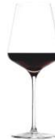
B657Q2310035 Burdeos Bordeaux 645 ml | 21¾ oz H 255 mm | 10" Ø 102 mm | 4" Palet: 216 pcs