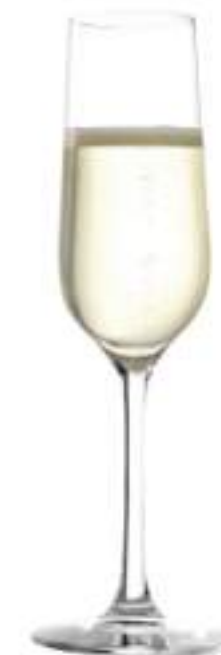
B657R2770007 Champán Champagne 200 ml | 6¾ oz H 225 mm | 9" Ø 75 mm | 3" Palet 600 pcs