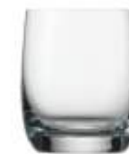
B657W1000014 Vaso Whisky Whisky Tumbler 190 ml | 6¾ oz H 81 mm | 3¼" Ø 67 mm | 2½" Palet 1.740 pcs