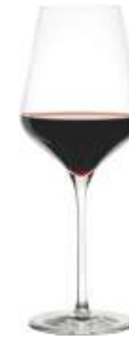
B657Q2310001 Vino Tinto Red Wine 570 ml | 19¼ oz H 250 mm | 9¾" Ø 96 mm | 3¾" Palet: 216 pcs