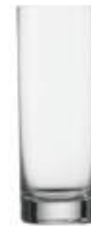
NEW YORK B657N3500011 Vaso agua Water Tumbler 260 ml | 8¾ oz H 140 mm | 5½" Ø 55,5 mm | 2¼" Palet 1.044 pcs