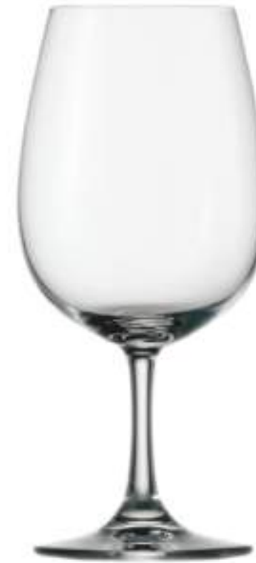
B657W1010001 Vino Tinto Pie Corto Red Wine Short 450 ml | 15¼ oz H 185 mm | 7¼" Ø 85 mm | 3¼" Palet 570 pcs