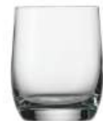
B657W1000016 Vaso Whisky D.O.F. Whisky Tumbler D.O.F. 350 ml | 12¾ oz H 91 mm | 3½" Ø 79,4 mm | 3" Palet 1.260 pcs