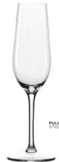
B657E1800017 Champán Champagne 195 ml | 6½ oz H 221 mm | 8¾" Ø 68 mm | 2¾" Palet 624 pcs