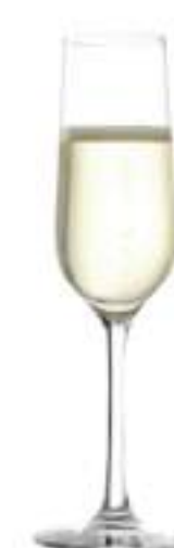
B657R3770007 Champan Champagne 200 ml | 6¾ oz H 225 mm | 9" Ø 75 mm | 3" Palet 600 pcs