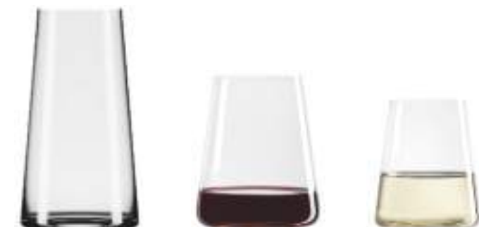
B657P1590009 Longdrink Longdrink 458 ml | 15½ oz H 144 mm | 5½" Ø 78 mm | 3" Palet 756 pcs