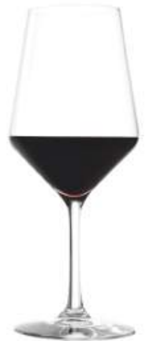
B657R2770035 Burdeos Bordeaux 650 ml | 22 oz H 240 mm | 9½" Ø 98,5 mm | 3¾" Palet 216 pcs