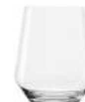
B657R3580016 Whisky Tumbler D.O.F. Whiskybecher D.O.F. 470 ml | 16 oz H 108,5 mm | 4¼" Ø 91,5 mm | 3½" Palet: 768 pcs