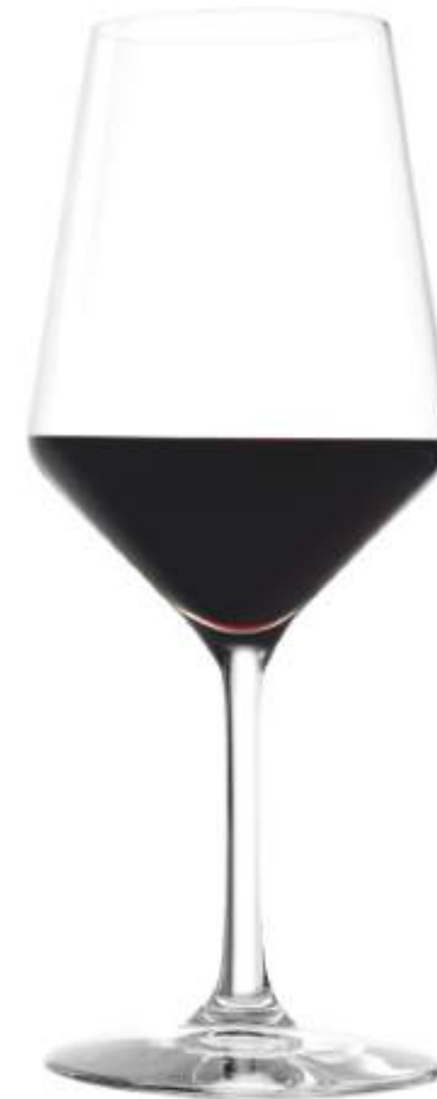
B657R2770001 Vino Tinto Red Wine 490 ml | 16½ oz H 225 mm | 9" Ø 90 mm | 3½" Palet 384 pcs