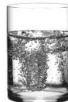
TAMESIS B657000 Vaso Bajo Whisky 505 ml H 114 mm Ø 82 mm Palet 798 pcs