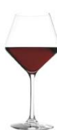
B657R3770000 Borgoña Burgundy 545 ml | 18¾ oz H 220 mm | 8½" Ø 107 mm | 4¼" Palet 264 pcs

La colección de copas de vino REVOLUTION ha sido diseñada conjuntamente por el arquitecto estrella Wilhelm Holzbauer y el experto en vinos Heinz Kammerer. El resultado son copas con un diseño extraordinariamente lleno de carácter, que al mismo tiempo permiten disfrutar de grandes vinos de forma sofisticada y exquisita. Cada forma de copa se adapta perfectamente a factores importantes como la acidez, la madurez, el contenido en taninos, la plenitud de aromas y la viscosidad. Durante la producción, el tallo se extrae del cáliz de la copa, lo que crea una transición elegante y moderna.