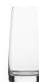
B657X3510022 Highball Highball 480 ml | 16¼ oz H 155 mm | 6" Ø 74 mm | 3" Palet 750 pcs