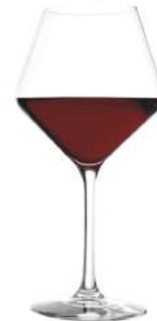
B657R2770000 Borgoña Burgundy 545 ml | 18¾ oz H 220 mm | 8½" Ø 107 mm | 4¼" Palet 264 pcs