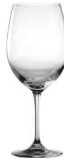
B657E1800035 Burdeos Bordeaux 640 ml | 21¾ oz H 229 mm | 9" Ø 95 mm | 3¾" Palet 288 pcs