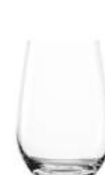
B657E3520012 Vaso Agua Water Tumbler 465 ml | 15¾ oz H 120 mm | 4¾" Ø 85 mm | 3½" Palet 672 pcs