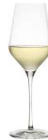
B657Q2310003 Vino Blanco White Wine 405 ml | 13¾ oz H 245 mm | 9¾" Ø 83 mm | 3¼" Palet: 408 pcs