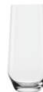
B657R3580012 Vaso Alto Longdrink 390 ml | 13¾ oz H 144 mm | 5¾" Ø 70 mm | 2¾" Palet 936 pcs