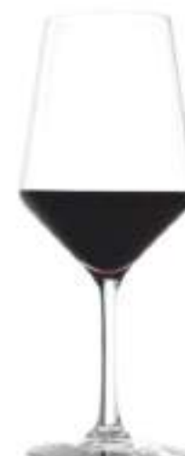
B657R3770035 Burdeos Bordeaux 650 ml | 22 oz H 240 mm | 9½" Ø 98,5 mm | 3¾" Palet 216 pcs