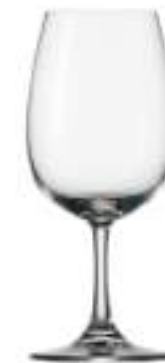
B657W1010002 Vino Blanco Pie Corto White Wine Short 350 ml | 11¾ oz H 175,5 mm | 7" Ø 79 mm | 3" Palet 504 pcs