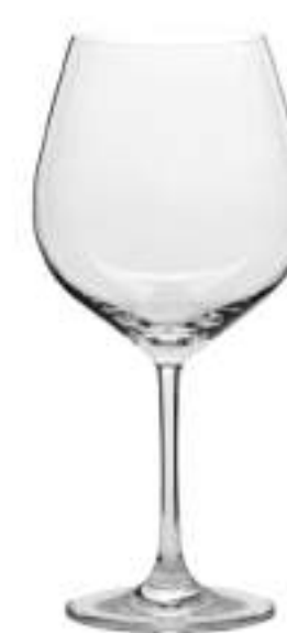
B657G2100000 Borgoña Burgundy 750 ml | 26 ½ oz H 225 mm | 9" Ø 109 mm | 4¼" Palet 264 pcs