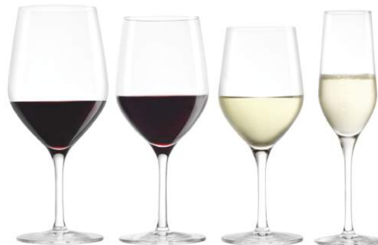
B657U3760035 Bordeaux Bordeaux 550 ml | 1 8¾ oz H 211,5 mm | 8¼" Ø 91,5 mm | 3½" Palet 384 pcs

Gracias a su bajo centro de gravedad, las copas se mantienen muy estables incluso cuando están llenas. A pesar de los tallos acortados, el cáliz de las copas son voluminosas para permitir un disfrute óptimo del vino.