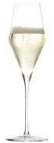
B657Q2310029 Campan Flute Champagne 290 ml | 9¾ oz H 260 mm | 10¼" Ø 82,5 mm | 3¼" Palet: 342 pcs