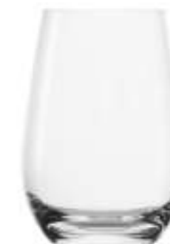
B657E3520022 Vaso Agua Grande Water Tumbler Large 660 ml | 22¼ oz H 135 mm | 5¼" Ø 95 mm | 3¾" Palet 576 pcs