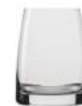
B657X3510016 Whisky D.O.F. Whisky becher D.O.F. 325 ml | 11 oz H 102 mm | 4" Ø 80 mm | 3¼" Palet 912 pcs