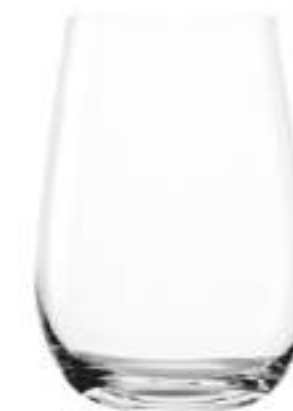
AZUR B657003 Vaso Tumbler 703 ml H 135 mm Ø 95 mm Palet 576 pcs