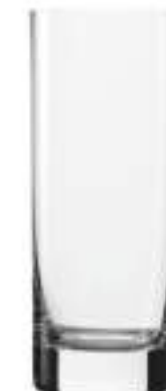
NEW YORK B657N3500022 Vaso Alto Highball 450 ml | 15¼ oz H 178 mm | 7" Ø 66 mm | 2½" Palet 930 pcs