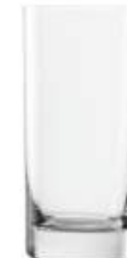
NEW YORK B657N3500023 Vaso Cerveza Beer Tumbler 535 ml | 18 oz H 160 mm | 6¼" Ø 76 mm | 3" Palet 756 pcs