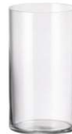
TAMESIS B657001 Vaso Alto Longdrink 657 ml H 145 mm Ø 81,5 mm Palet 684 pcs