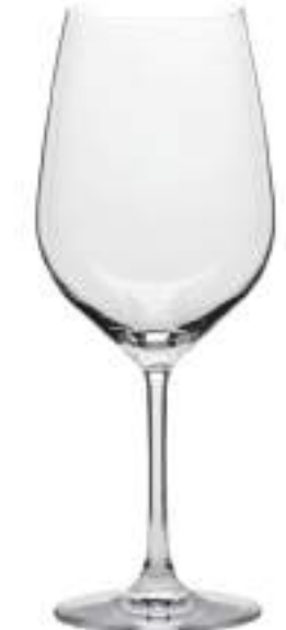
B657G2100035 Burdeos Bordeaux 650 ml | 23 oz H 239 mm | 9½" Ø 95 mm | 3¾" Palet 288 pcs