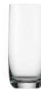
B657W1000012 Vaso Alto Longdrink 390 ml | 13¾ oz H 145 mm | 5¾" Ø 66 mm | 2½" Palet 1.116 pcs