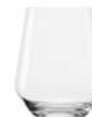
B657R3580016 Whisky D.O.F. Whiskybecher D.O.F. 470 ml | 16 oz H 108,5 mm | 4¼" Ø 91,5 mm | 3½" Palet 768 pcs