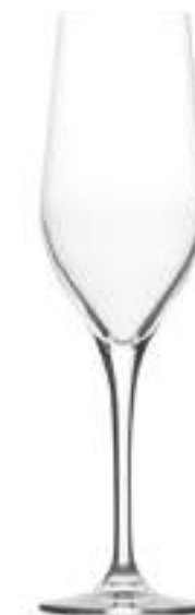
B657G2100029 Champán Champagne 285 ml | 10 oz H 231 mm | 9" Ø 68 mm | 2¾" Palet 450 pcs