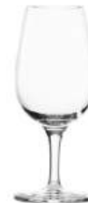
INAO CATAVINOS B657C1060031 Catavinos Tasting Glass 200 ml | 6¾ oz H 150 mm | 6" Ø 65 mm | 2½" Palet 930 pcs