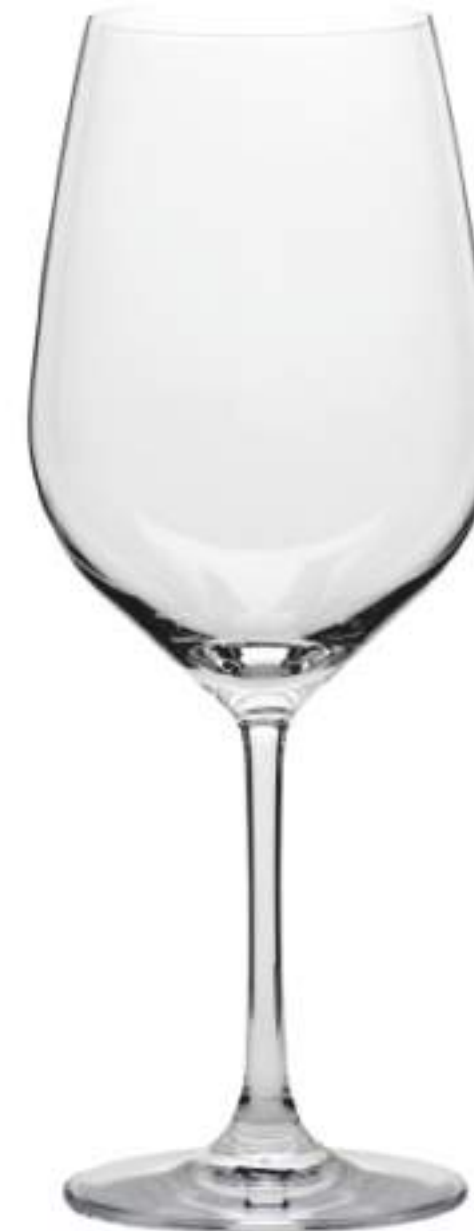
B657G2100001 Vino Tinto Red Wine 495 ml | 17½ oz H 227 mm | 9" Ø 87 mm | 3½" Palet 342 pcs