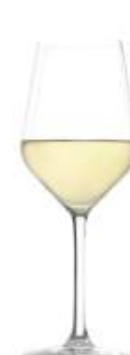
B657R3770002 Vino Blanco White Wine 365 ml | 12¼ oz H 220 mm | 8½" Ø 82 mm | 3¼" Palet 456 pcs