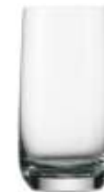
B657W1000009 Vaso Zumo Juice Tumbler 315 ml | 11 oz H 124 mm | 5" Ø 66 mm | 2½" Palet 1.392 pcs