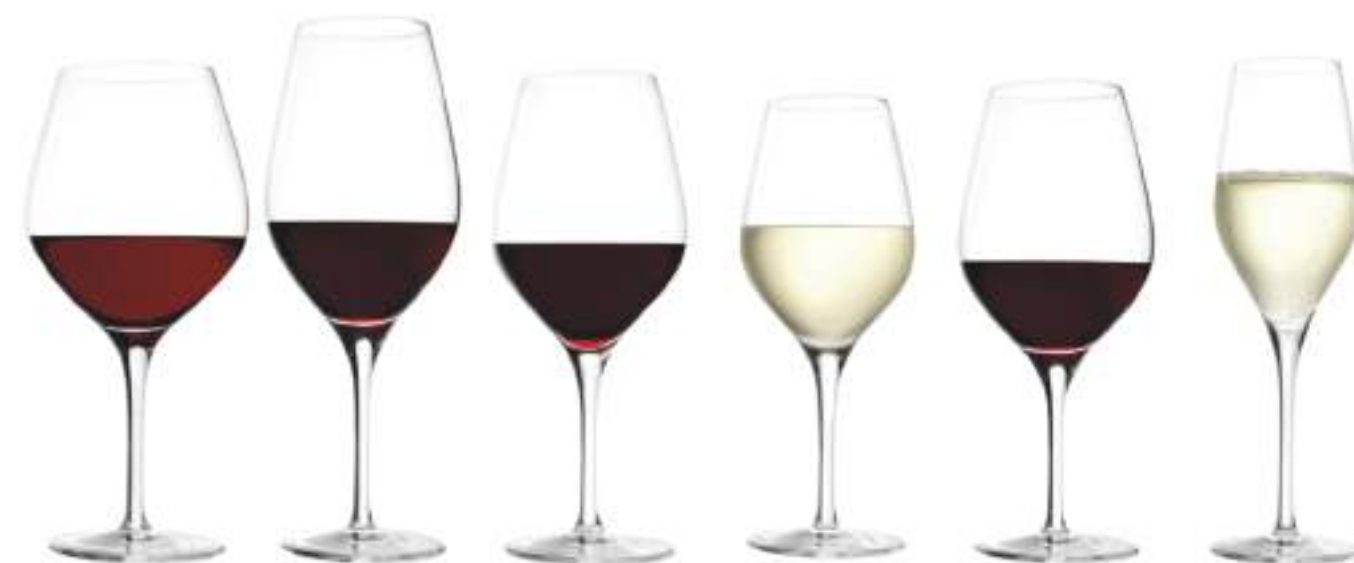
B657X1470000 Borgoña Burgundy 650 ml | 22 oz H 222 mm | 8¾" Ø 105 mm | 4" Palet 288 pcs

EXQUISIT de Stölzle Lausitz se caracterizan por sus proporciones equilibradas y sus formas suaves y redondeadas. Los tallos de estas copas de belleza atemporal son estirados, lo que las hace especialmente resistentes a las roturas. La forma de la copa es tal, que su mayor diámetro se encuentra en el tercio inferior. De este modo, el vino que se vierte en ella dispone de una gran superficie para reaccionar con el aire. El cáliz se estrecha hacia la parte superior, lo que permite que los aromas del vino se desarrollen de forma óptima y sin pérdidas. Por su diseño elegante y su fabricación, las copas EXQUISIT son muy adecuadas para su uso en la hostelería, pero también son ideales para el uso privado en el hogar.