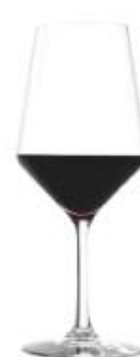
B657R3770001 Vino Tinto Red Wine 490 ml | 16½ oz H 225 mm | 9" Ø 90 mm | 3½" Palet 384 pcs