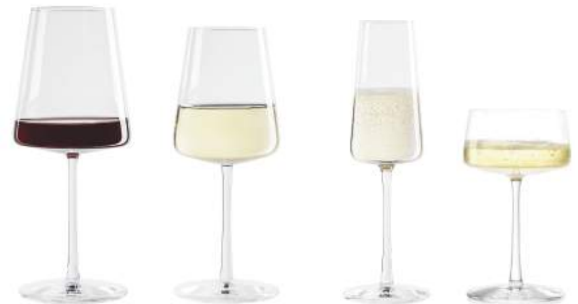
B657P1590001 Vino Tinto Red Wine 520 ml | 17½ oz H 226 mm | 9" Ø 93 mm | 3¾" Palet 384 pcs

El llamativo cáliz está sostenido por un tallo ligeramente entallado, pues se fusiona a la perfección, confiriendo al conjunto una sorprendente ligereza, al tiempo que subraya la sencillez del diseño.