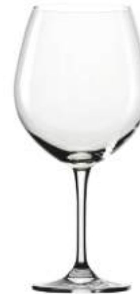
B657E1800000 Borgoña Burgundy 770 ml | 26 oz H 222 mm | 8¾" Ø 109 mm | 4¼" Palet 264 pcs