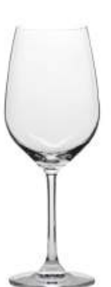
B657G2100003 Vino Blanco White Wine 390 ml | 13¼ oz H 212 mm | 8¼" Ø 79 mm | 3" Palet 504 pcs